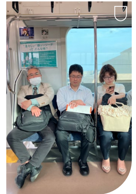
In Japan zijn nog miljoenen onbereikte mensen.

In Jesaja 25 lezen we over een 'vette maaltijd' die God bereidt voor 'alle volken'. Wij gaan bij elkaar eten om contacten te onderhouden en vriendschapsbanden aan te halen. Deze tekst vertelt dat God de maaltijd met de mens wil houden. Wij kennen dit beeld van het Heilig Avondmaal. Maar deze heilsmaltijd is breder dan dat: hij wijst op de gemeenschap met God, op vrede, vergeving en een vertrouwelijke omgang met de Heere door Christus. Midden in Jesaja 25 staat de belofte: 'Hij zal de dood verslinden tot overwinning' (vs. 8a). De dood is in de wereld gekomen door de zonde en heerst over alle mensen. Niemand kan zich aan de macht van de dood onttrekken. Ieder van ons zal eens de strijd met de dood moeten aanbinden. De macht van de dood is ook zichtbaar in de zonden die we doen en de blindheid die ons van nature bezet. De dood heerst over de volkerenwereld: niemand vraagt uit zichzelf naar God, Zijn Schepper. Jesaja heeft het over een 'bewindsel', een